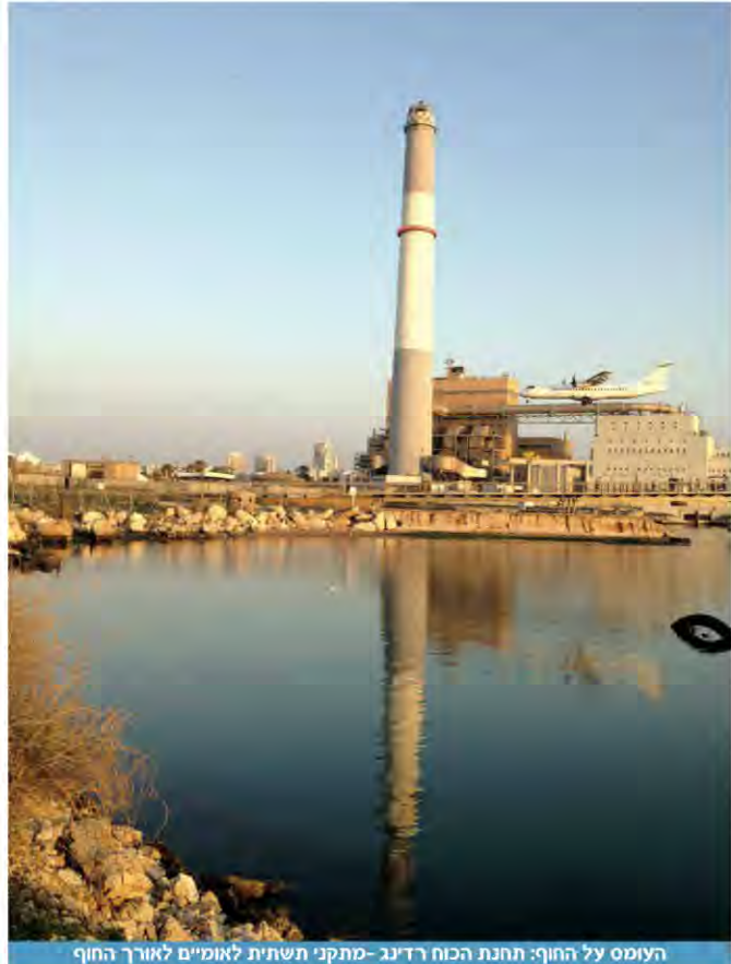
העומס על החוף: תחנת הכוח רדינג-מתקני תשתית לאומיים לאורך החוף