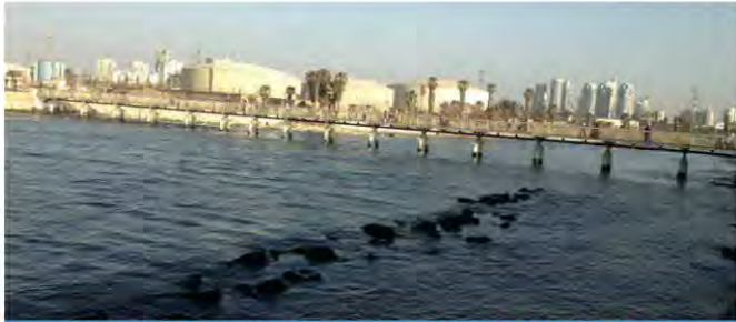
גשר להולכי רגל לצד מתקני תשתית, חלק מלחצי הפיתוח לאורך חוף הים.