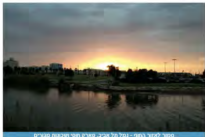
סמוך לאזור החוף - נמל תל אביב, פארק חופי ושכונות מגורים

הכוונה לחוקים, תקנות, תוכניות שעל פי חקיקה, תוכנית של בנין עיר, איכפה ובעצם לכל המכלול שמגובה בחוקים או תקנות.