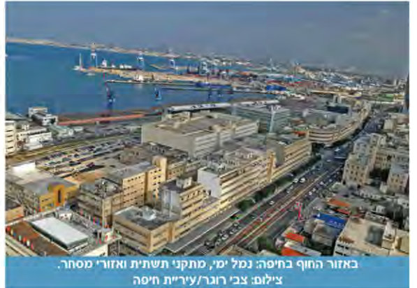
באזור החוף בחיפה: נמל ימי, מתקני תשתית ואזורי מסחר.

אודות הפרויקט ועל המלצותיה שבכללן השלמת הבעלות הציבורית על כל אזור החוף, ביטול זכות הפיצויים ועוד. ביקשנו גם את התייחסותה להחלטת הוועדה שהתקבלה לאחרונה.