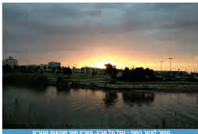
סמוך לאזור החוף - נמל תל אביב, פארק חופי ושכונות מגורים

הכוונה לחוקים, תקנות, תוכניות שעל פי חקיקה, תוכנית של בנין עיר, אכיפה ובעצם לכל המכלול שמגובה בחוקים או תקנות.