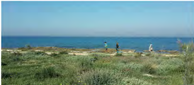
טיילת חוף שקמונה, חיפה. באדיבות: גרינשטיין הר-גיל אדריכלות נוף ותכנון סביבתי