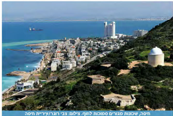
חיפה, שכונת מגורים סמוכות לחוף.